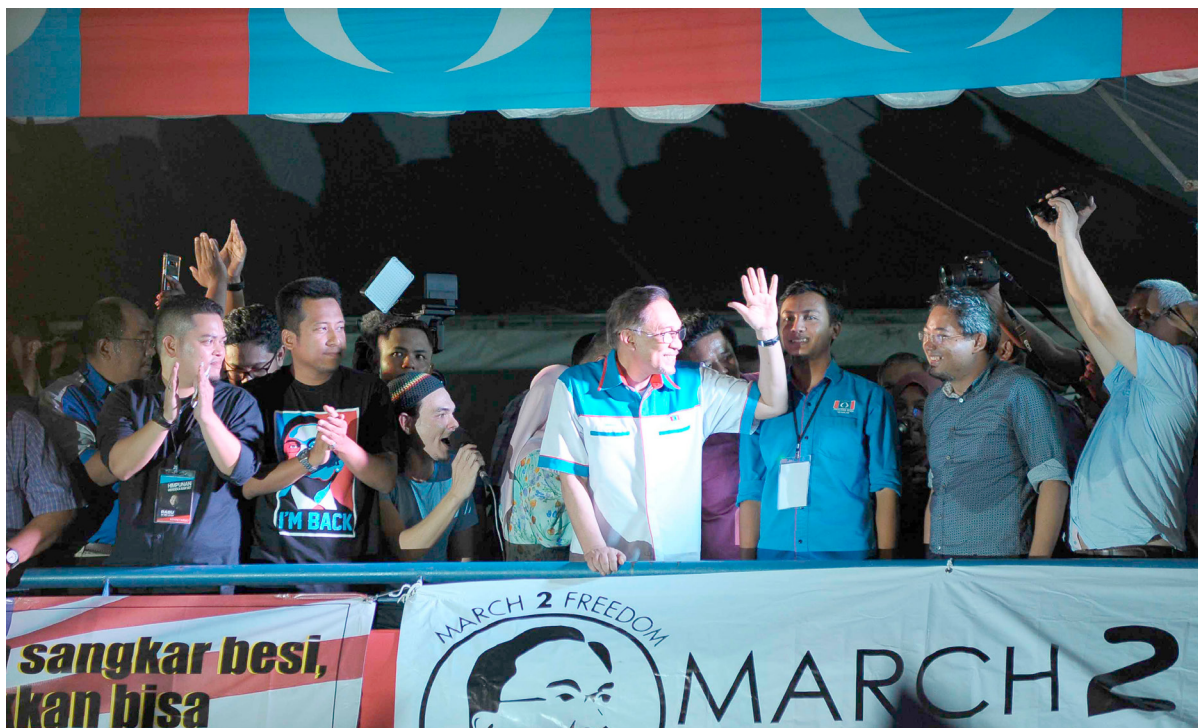
Anwar Ibrahim bei einer Rede kurz nach seiner Freilassung

Muhyiddin. DAP, PKR, AMANAH und Bersatu bildeten fortan die Pakatan Harapan (PH) oder Hoffnungsallianz, und der Beitritt der beiden neuen Parteien sollte sich im Nachhinein als wahlentscheidend herausstellen.